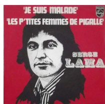
Je suis malade Serge Lama

Merci à tous pour votre participation, voici quelques uns des titres qui nous ont été proposés.