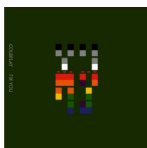
Fix You Coldplay