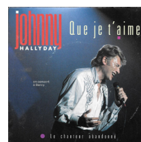
Que je t'aime Johnny Hallyday