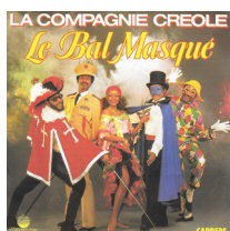
Le Bal Masqué La compagnie Créole